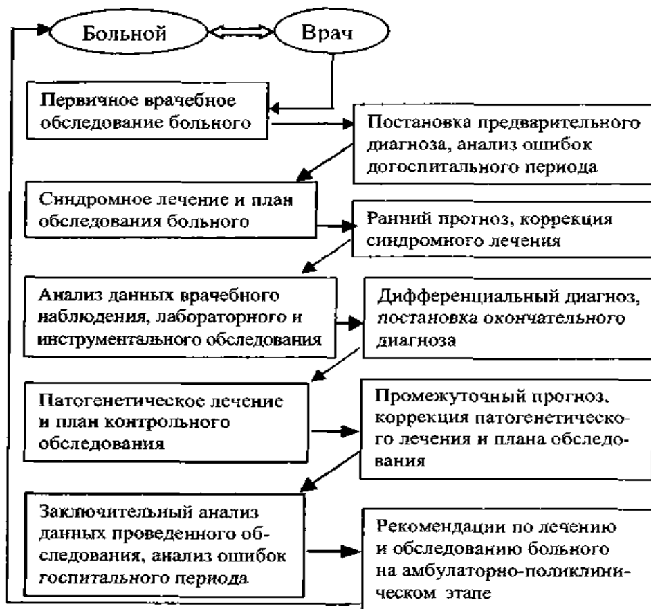
Рис. 5. Современный алгоритм лечебно-диагностического процесса в стационаре

Правильно оформленная схема с подрисуночной подписью должна выглядеть следующим образом: